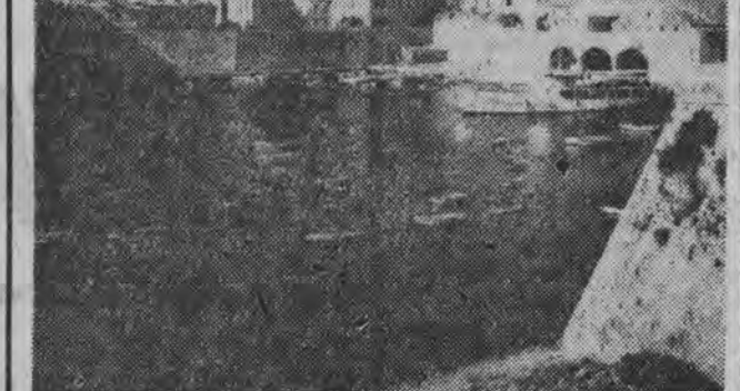
Dubrotenniki (Jugoslaws) at the tomb of a nobleman — mury obrowne, baszty, pałace, kościoły i kamienne mury o dawnej świetności tego miasta.

WARSZAWA (PAP) 6. 4. Do dyrektora Polskiej Linii Anielskiej w Gdyni nadano petycję od dowódcy statku „Kazimierz” z prośbą o wyrażenie zgody na wyjazd z Gdyni do Hawajów. Kapitan statku „Kazimierz” z prośbą o wyrażenie zgody na wyjazd z Gdyni do Hawajów.