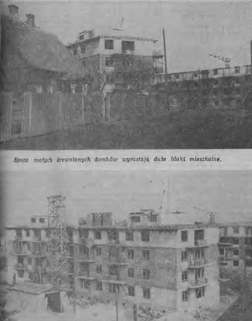
W 6 takich budynkach zamieszka 234 rodziny.