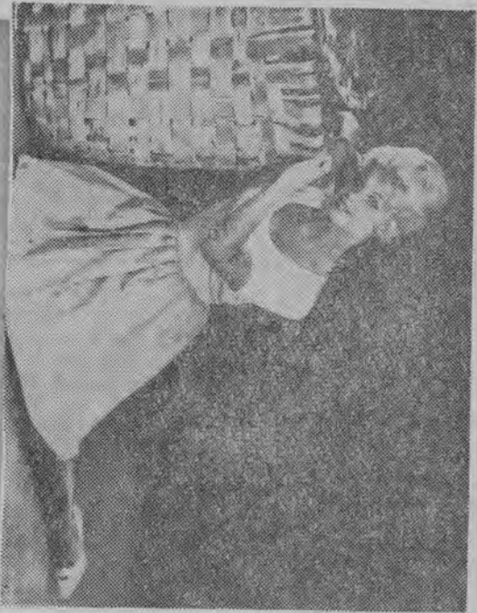
Występowała w programie rozgłośni Las Palmas (Wyspi Kanaryjskiej), gdzie ujęła tytuł „Mistrzyni Europy” w grze na saksofonie. Kariera muzyczna nie przeszkodziła jej w zdobyciu jeszcze jednego tytułu — mistrzynie w specjalności elektronowych maszyn kalkulacyjnych. To się nazywa wszechstronny talent!

Zmiana ruchu drogowego z lewostronnego na prawostronny ma nastąpić na skutek przysąpienia W. Brytanii do wspólnej rynek.