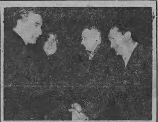
NA ZDJĘCIU: powitanie min. A. Rapackiego na lotnisku Okęcie.

Zacząło się nieźle, można liczyć na większe niż dotychczas postępy