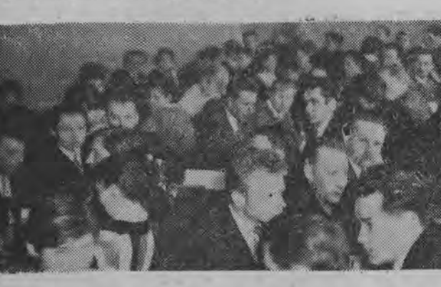
NA ZDJĘCIU: widok sali obrad IV Konferencji ZMS.