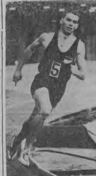
NA ZDJĘCIU: Peter Snell (Nowa Zelandia) najlepszy obecnie średniodystansowiec świata podczas biegu halowego w Tokio na 800 y. Użył w nim doskonały czas 1:49,9.

Potężna, około 10-tysięczna armia pracowników białostockich zakładów włókienniczych reprezentują klub Sportowy Włókniarz Białystok. W tym kontekście nie będzie wcale przesadą, jeśli stwierdzimy, że Włókniarz powinien stać się naszym „łódzkim LKS-em” bądź zabrzaskim Górnikiem. Mimo niewątpliwych sukcesów, jakie zanotował wreszcie ten 7-sekcyjny klub w 1961 r. (najlepszy zespół szczyplornistów okręgu, III-liga w piłce nożnej, do siatkarzy i koszykarzy doszli doświadczeni w skawojewództwa ping-pongistów, nasz potencjalny „kolos” boryka się jeszcze z zbyt licznymi trudnościami, aby można spokojnie czekać na jego dalszy błyskotliwy marsz w górę. Cieszy jednak fakt, że owe słabości, niedomagania wyciągnięta odważyła „na stół” Rada Seniorów Włókniarza na ostatnim posiedzeniu, podejmując przy tym naprawdę cenne uchwały. Załować jedynie należy, że na tak ważnym seminarium zabrakło przedstawicieli zakładów garbarskich, do których Rada Seniorów ma z tego powodu uzasadnione pretensje.