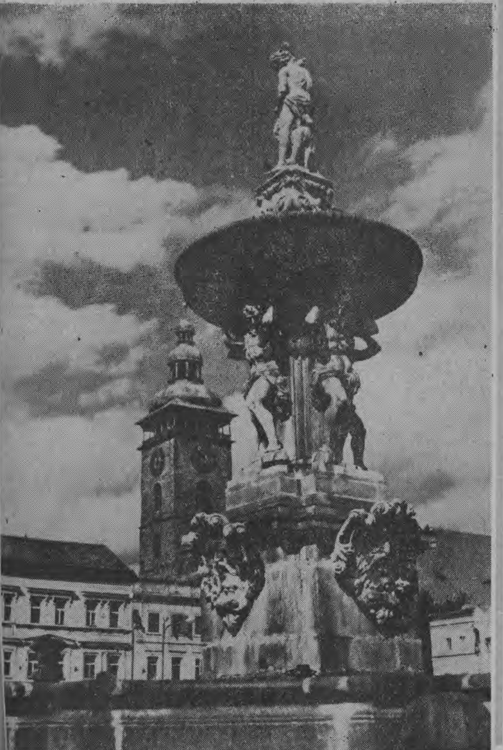
Stara fontanna i Czarna Wieża na Placu Głównym w Czeskich Budziejowicach.