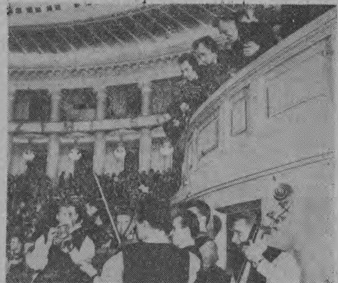
NA ZDJĘCIU: na sali przed rozpoczęciem obrad II Zjazdu ZMW.

Trzecia część XVI sesji Zgromadzenia Ogólnego NZ rozpocznie się w pierwszych dniach czerwca.