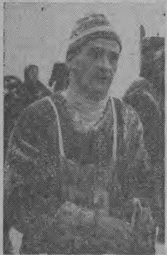
Fama o dużej klasie Recknagla nie okazała się przesadzoną. Reprezentant NRD potwierdził ją w ostatnim dniu mistrzostw w otwartym konkursie skoków na Dużej Krokwi, zwyciężając bezapelacyjnie.

Złoty medalista zakopiańskiego „maratonu” i uczestnik zwycięskiej sztafety