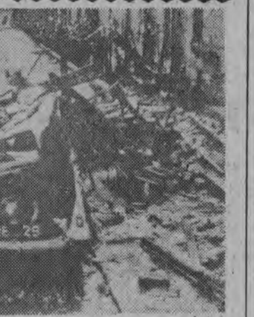
Silne wichury, jakie nawiedziły Anglię 11-12 lutego wyrządziły wielkie straty, a nawet spowodowały w miastach wypadki śmiertelne. W miejscowości Leeds, odłamki muru i blachy strząsały samochód zaparkowany na ulicy. NA ZDJĘCIU: szczytki samochodów.

15 tys. żołnierzy Bundeswehry pracuje przy naprawie uszkodzonych wałów ochronnych wzdłuż ujścia Łaby. Długość wałów uszkodzonych przez fale sięga około 100 km. W akcji ratowniczej bierze również udział 100 helikopterów wojskowych, które ewakuują ludność z terenów, odciętych przez powódź.