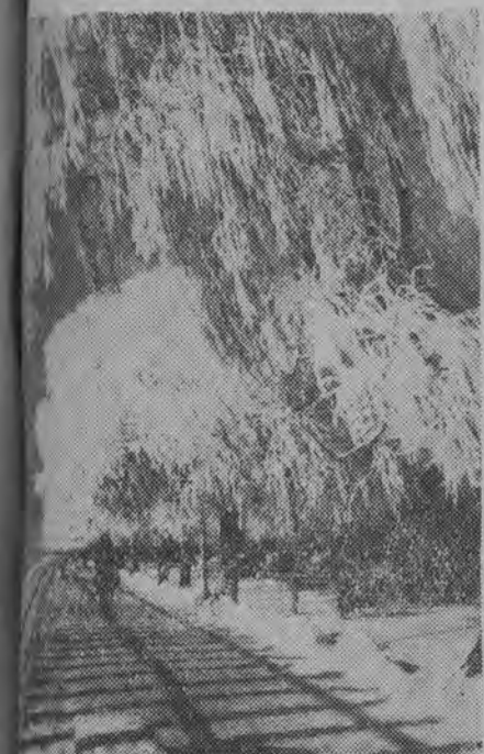
— stolica prowincji tej samej nazwy w zach. Północno-Wschodnich położona jest w zimna. Od października pada tam śnieg i wciąga jeszcze trwa zima. NA ZDJĘCIU: ośnieżone wierzby nad brzegiem rzeki Sungari.