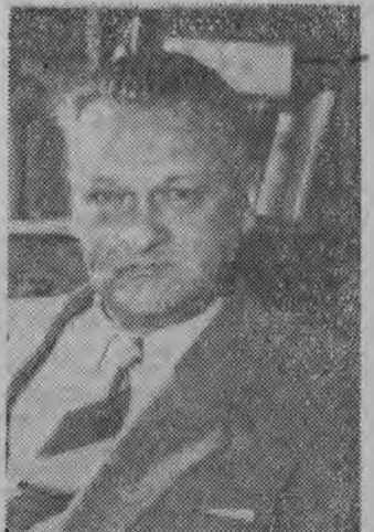
WŁADYSŁAW BRONIEWSKI POL — CAF

W sobotę, 10 bm. we wczesnych godzinach popołudniowych zmarł w Warszawie w wieku 64 lat jeden z najwybitniejszych współczesnych poetów polskich Władysław Broniewski.