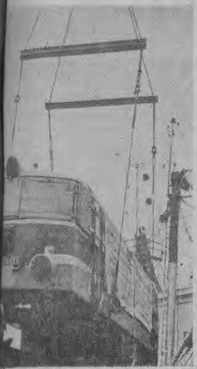
W Gdyni przybył statek PZM „Witka” przywożąc wśród kilkuset ton uniwersalną lokomotywę elektryczną „Bo-bo” o wadze 80 ton. Polska w Anglii 20 takich lokomotyw, w zasilają tabor na zelektryfikowanych trasach kolejowych.