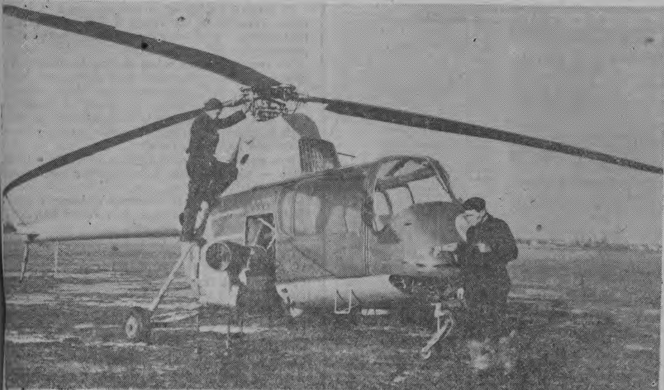
W okresie trwania VII Sanedzka rskich Mistrzostw Świata w Krynicy i FIS w Zakopanem, Warszawskie Pogotowie Lotnicze oddlegowało w ten rejon 2 śmigłowce sanitarne.

NA ZDJĘCIU: antymilitarystyczne plakaty na murach Lille policyjnego departamentu w północnej Francji.