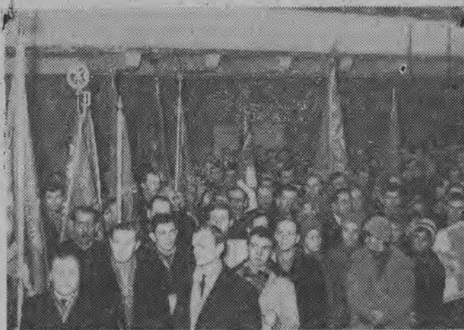
NA ZDJĘCIU: uczestnicy wiecu.

Jutro zamieścimy krótki fragment „Gałązki Jedliny”.