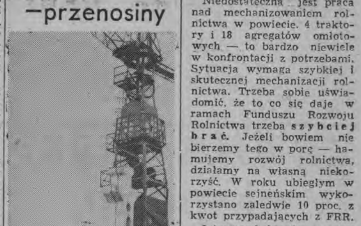
Innowołańska Fabryka Sprzętu Rolniczego w L. Nowołańsku w 1964 roku przeniesie się do nowo powstałego zakładu, zaprojektowanego przez „Przemysł” Poznań. Zakład wyposażony zostanie w najnowocześniejsze maszyny i urządzenia pozwalające na wprowadzenie mechanizacji i automatyzacji w służbę produkcyjnej hali produkcyjnej.