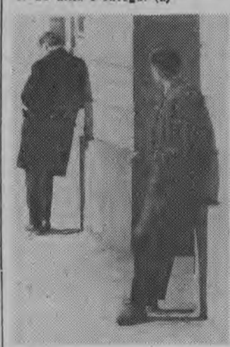
NA ZDJĘCIU: jedna z prac umieszczonych na wystawie.

Wystawę „W kręgu życia” warto więc zobaczyć. Czynna ona jest w sali WDK w godz. 13-17 do dnia 1 lutego. (a)