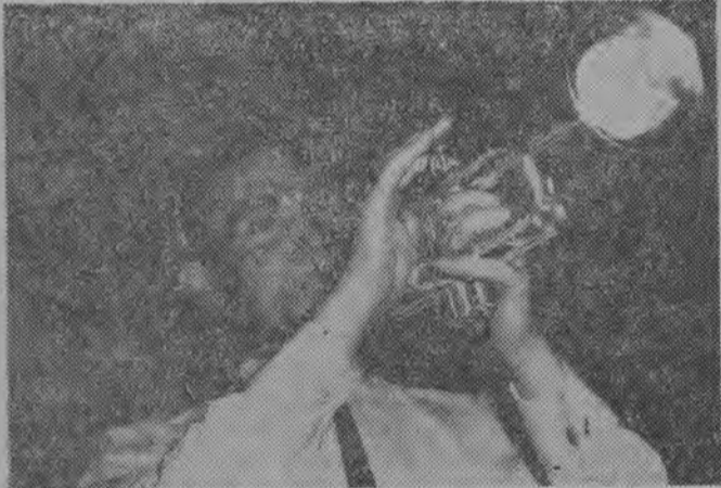
Mile tony wydawała srebrna trąbka...