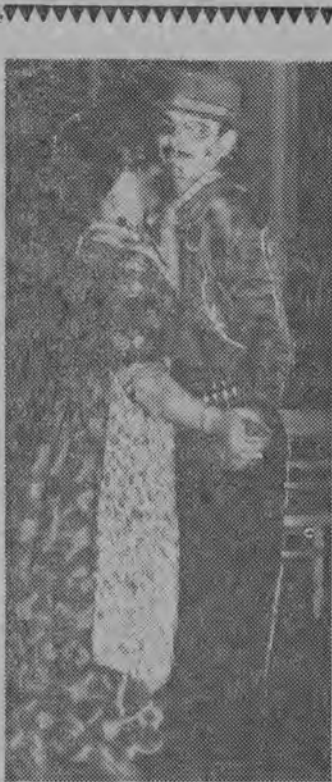
NA ZDJĘCIU: argentyńskie tango tańczy „Cyganka” z „Meksykańczykiem”.

W chwilach odpoczynku swą zręcznością „czarował” zebranych znany iluzjonista Petroni. Odbyło się też wiele konkursów. Największym powodzeniem cieszył się konkurs na najlepiej tańczącą parę. (Let)