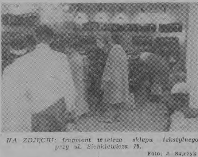
NA ZDJĘCIU: fragment wierzchołka sklepu tekstylnego przy ul. Sienkiewicza 18.

W YDAJE SIĘ, iż słuszny postulat Komisji Ochrony Porządku, który w formie wniosku został przekazany Prezydium MRN, zasługuje na pełne poparcie i wprowadzenie w życie. (h)