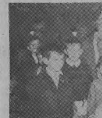
Dzieci z Państwowego Domu Dziecka na imprezie noworocznej.

gorsze? Dzieci muszą więc mieć choinkę noworoczną, na której pobawią się, potańczą. Ostatnio choinka taka zorganizowała dla dzieci swych pracowników rada zakładowa Białostockiego Zarządu Aptek. W imprezie, która odbyła się w kawiarni Związków Zawodowych, wzięło udział 150 dzieci z Białegostoku. Dzieci uczyły się piosenki, tańczyły, brały udział w konkursach, no i otrzymały paczkę.