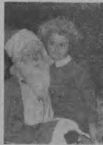
Gdy się dostało paczkę, nawet brodaty Dziadek Mróz niestraszny i można się do niego przytulić.

Gdy na ulicy pojawi się gromadka dzieci z balonikami, kotylionami i paczkami w rękę — od razu wiadomo — odbyła się jeszcze jedna choinka noworoczna. W zakładzie pracy, w przedszkolu, żłobku czy w szkole — choinki odbywają się wszędzie. Cóż — dorośli mają zabawy karawalowe, a maluchy to