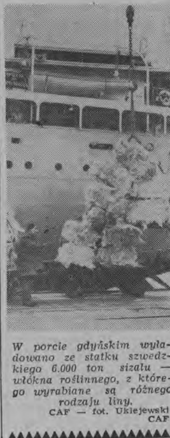
W porcie gdyńskim wyladowano ze statku szwedzkiego 6.000 ton szalatu — włókna roślinnego, z którego wyrabiane są różnego rodzaju liny.

DELHI (PAP) 3. 1. Rząd indyjski podał, że podczas wyważania enklaw portujskich na terenie Indii — Goa, Oman i Diu zginęło 39 osób. Po stronie indyjskiej śmierć poniosły 22 osoby, a ze strony portugalskiej zginęło 17 oficerów i żołnierzy. Poza tym 53 rannych i 21 Portugalczyków zostało rannych.