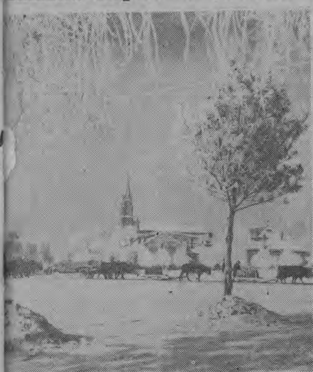
ZDJĘCIU: zimowy obrazek na przedmieściu Kirina.

staśmy zupełnie pewni całkowitego stałecznego zwycięstwa komunizmu".