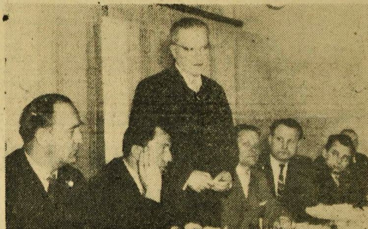
NA ZDJĘCIU: minister Rybicki mówi o roli sądownictwa w PRL na spotkaniu z przedstawicielami władz powiatowych, organizacji politycznych oraz pracownikami sądownictwa, prokuratury i adwokatów.