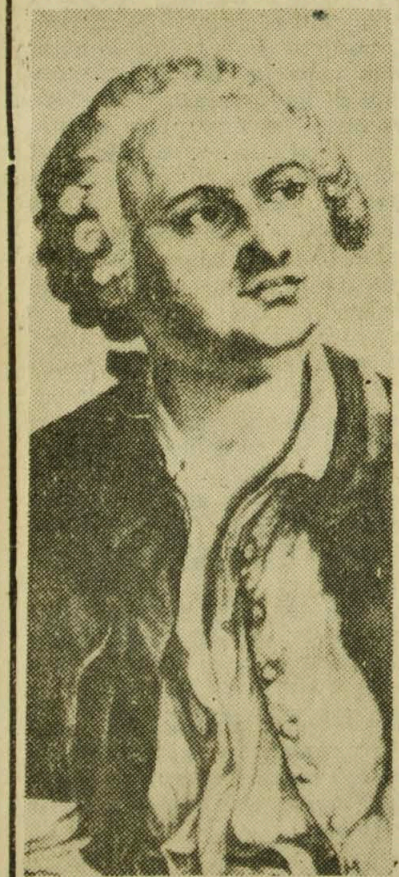
NA ZDJĘCIU: Michał Łomonosow.

Pod względem wielostronności geniuszu, siły myśli i głębi wiedzy, pod względem śmiałości projektów i niezwykle namięt-