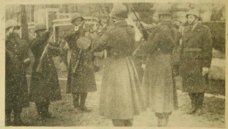
NA ZDJĘCIU: młodzi żołnierze składają przysięgę na sztandar jednostki.