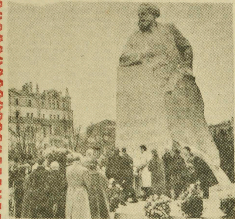
Mieszkańcy Moskwy składają kwiaty pod pomnikiem Karola Marksa w Moskwie.