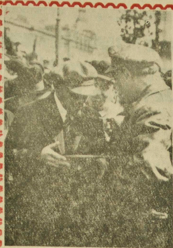
W. I. Lenin na uroczystym wiecu 1 Maja 1920 r. w Moskwie, podczas którego położono kamień węgielny pod pomnik Karola Marksa.