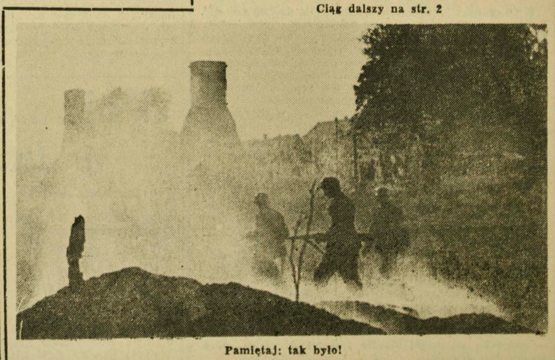
Pamiętaj: tak było!

Wiele pomogli nam w tym nasi Czytelnicy, informując nas o różnego rodzaju faktach, dzieląc się z