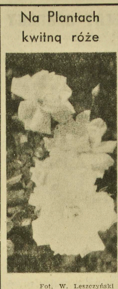
Na Plantach kwitną róże

Giełda odbędzie się w dniach 4 - 5 sierpnia w gmachu WZGS przy ul. Sienkiewicza 55.