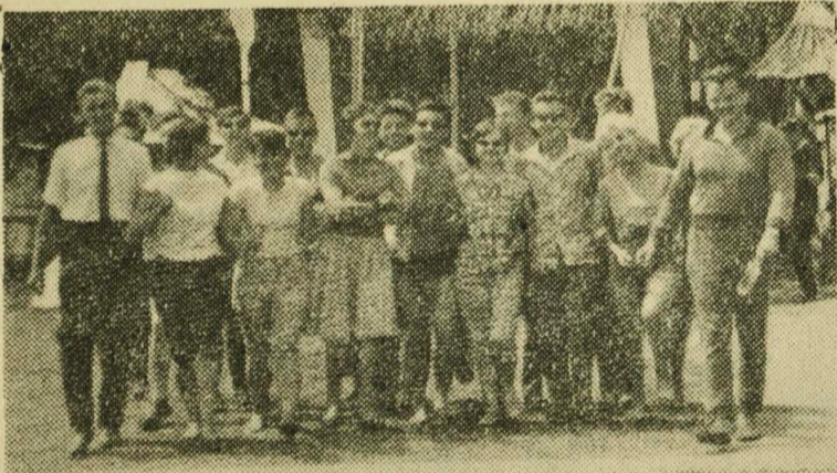
Wymarsz grupy młodzieży na wycieczkę kajakową.

W bieżącym roku fabryka w Świdnicy wybuduje kilkadziesiąt wagonów - kolosów. Są one przeznaczone głównie na eksport do Związku Radzieckiego. (PAP)