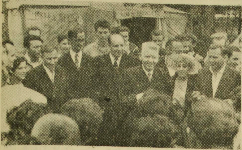
W serdecznej atmosferze upłynęło spotkanie uczestników obozu z członkami delegacji radzieckiej z Grodna.