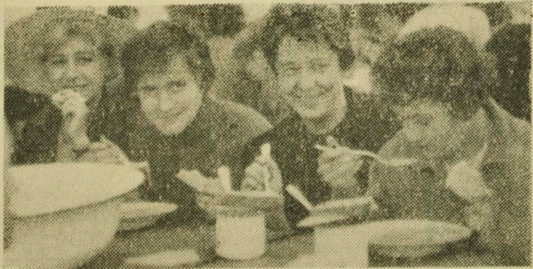
Równie przyjemny jest w programie dnia smaczny obiad.