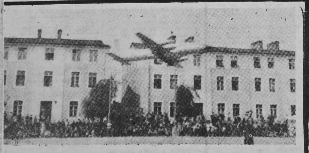
Z mistrzostw Polski model latający na uwlezi. NA ZDJĘCIU: 4-silnikowy model Bristol-Britannia wystartował do zawodów

Czekamy na meldunki z innych miast. (ko)