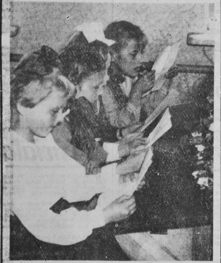
Co za radość po pierwszym roku nauki przeczytać świadectwa i to z dobrymi ocenami. Bądź co bądź to już klasa DRUGA. (O zakończeniu roku szkolnego — czytaj na str. 3).