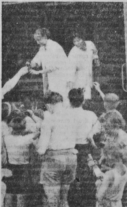
Ruchome kioski na samochodach, jakie zjawiają się ostatnio w każdej niedzieli w Białostoku. Zwierzęta mają duże powodzenie. Szczególnie chodliwe są napoje chłodzące i słodczyca.