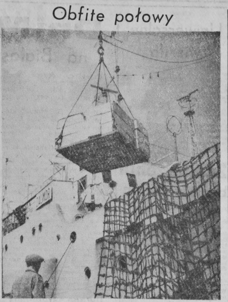
Obfite połowy Trawler - przetwórnia „Dalmor” po 114 dniach połowów w pobliżu wybrzeży Nowej Fundlandii i Labradoru powrócił do Gdyni. Złowiono ogółem 1084 tony ryb, przede wszystkim dorsza, karmazyna i pastusg. Na statku wyprodukowano m. in. 187 ton mrożonych filetów dorszowych, 83 tony filetów z karmazynów i 112,5 tony maczki rybnej. NA ZDJĘCIU: wylądunek mrożonych filetów z karmazynów zapakowanych w kartony. (CAF - fot. Ukielewski)

Zraniony przez kłusownika jeleń wskoczył z urwiska Robotnicy kamieniołomów Osieciu (woj. krakowskie) znaleźli w ostatnich dniach przewróconego, który spadł z urwiska i zabił się. Już pierwsze oględziny wykazały, że zwierzę było zranione eksplozją przez kłusownika i uciekło przed nim ratując się skokiem ze skalnego urwiska. Kłusownictwo w rejonie Góry powoduje szkodę w zwierzęstwie niemałą. Ostatniej zimy zabito kilka sztuk dzikich saren, nie mówiąc o mniejszej zwierzynie. (PAP)