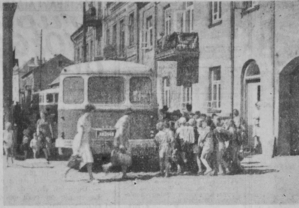
NA ZDJĘCIU: dzieci pod opieką nauczycielek i matek wsiadają do samochodów.

Z okazji trwających jeszcze obchodów Międzynarodowego Dnia Dziecka, uczniowie szkoły podstawowej nr 12 w Białymstoku wzięli udział w wycieczce do Mąjówki. W wycieczce tej, która odbyła się 5 bm., udział wzięło około 500 uczniów. Na pięknej, słonecznej polanie dzieci otrzymały słodczyce i napoje chłodzące. Piękna pogoda i humor dopisywały.