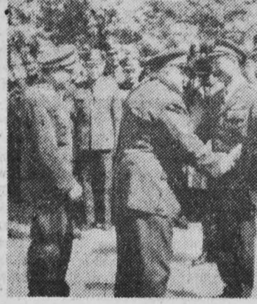
NA ZDJĘCIU: powitanie na lotnisku Okęcie w Warszawie, przybycie do Polski delegacji Czechosłowackiej Armii Ludowej.

Bawiąca w naszym kraju z rewizytą delegacja Czechosłowackiej Armii Ludowej z min. obrony narodowej gen. armii Bohumirem Lomským przybyła 24 bm. specjalnym pociągiem do Krosna. Wraz z gośćmi czechosłowackimi przybył minister Obrony Narodowej PRL, gen. broni Marian Spychalski. Kolumna wozów rusza przez miasto, udając się do Dukli. Kolumna zatrzymuje się na położonym tuż przed Duklą cmentarzu żołnierzy radzieckich i czechosłowackich. Na cmentarzu w obecności przybyłej licznie ludności odbyła się uroczystość składania wienieców — od Armii Czechosłowackiej, Wojska Polskiego i władz wojewódzkich. Następnie po zwiedzeniu miasta Dukli goście serdecznie zegnani, udali się w dalszą podróż do Krakowa. (PAP)