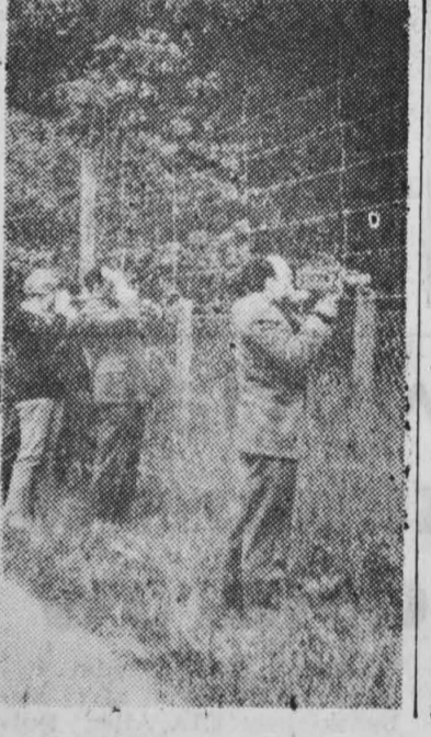
Realne pogroźki ultrasowskich terrorystów zmuszają władze szwajcarskie i francuskie do podjęcia bardziej idących środków ostrożności.

NA ZDJĘCIU DOLNYM: siedziba algierskiej delegacji w oddanej jej dyspozycji podgenewskiej posiadłości „Bois d'Avault”, otoczona jest pierścieniem uzbrojonych patroli przez szwajcarską armię i policję. Wszyscy, którzy