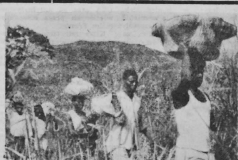
W Angoli straszy się terror partykularnych kolonizatorów, rozstrzelujących w walce z walczącymi o wolność ludnością. Nieskańską ochronienia na obczyźnie.

Przyjazd delegacji grodzieńskiej do Białegostoku oraz pobyt naszych budowniczych w Grodnie przyczyni się niewątpliwie do zacieśnienia współpracy i zapewni stałą wymianę doświadczeń w dziedzinie budownictwa między Grodnem a Białymstokiem. (t)