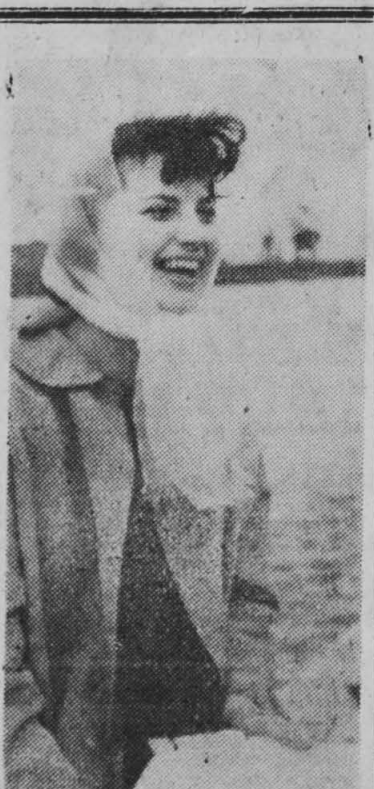
Optymizm na przekór... pogodzie

Zachmurzenie umiarkowane. Na północy woj. możliwe przelotne opady. Temperatura maksymalna około 17 st. C. Wiatry słabe, okresami umiarkowane północno-zachodnie i zachodnie.