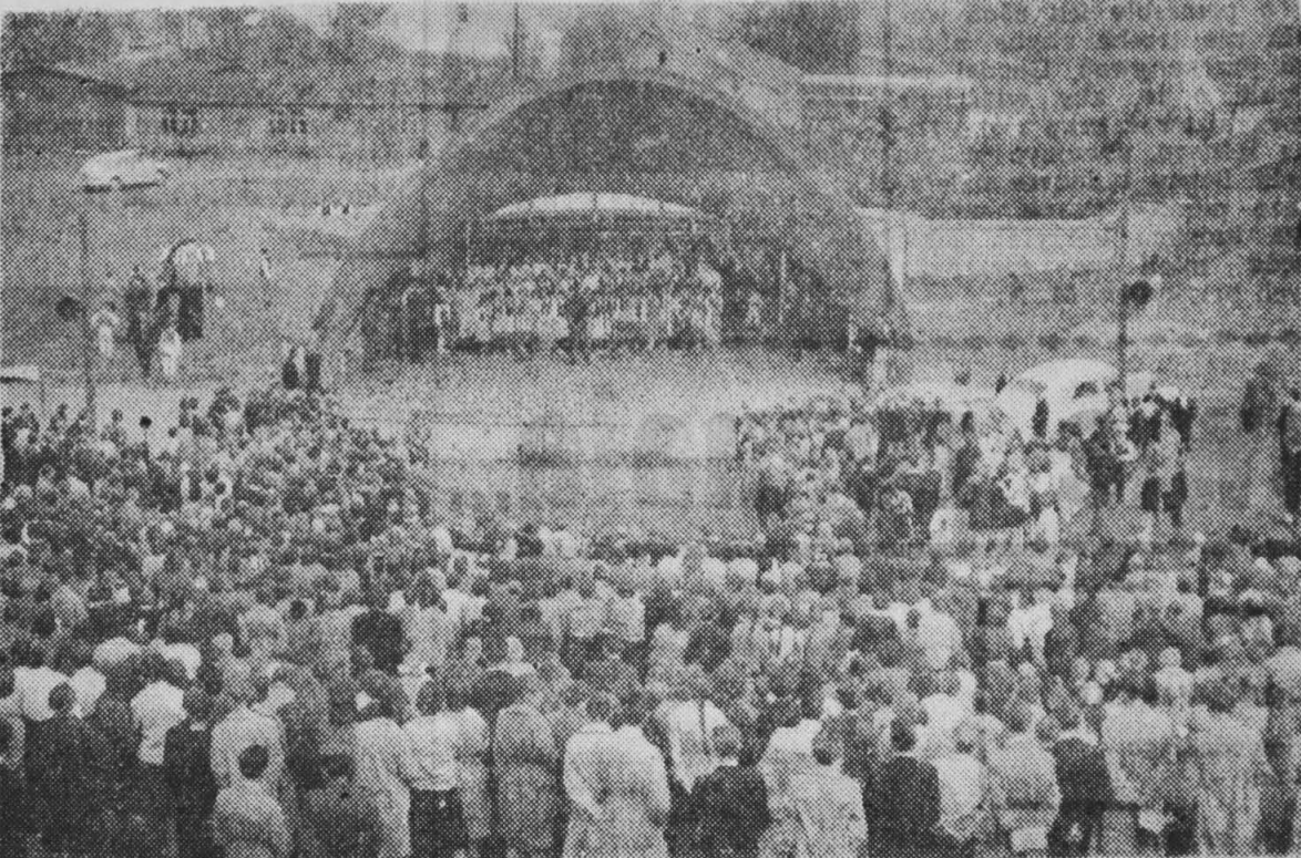
Kilka tysięcy osób oglądało występy estradowe, obserwując popisy z olbrzymiego naturalnego amfiteatru.