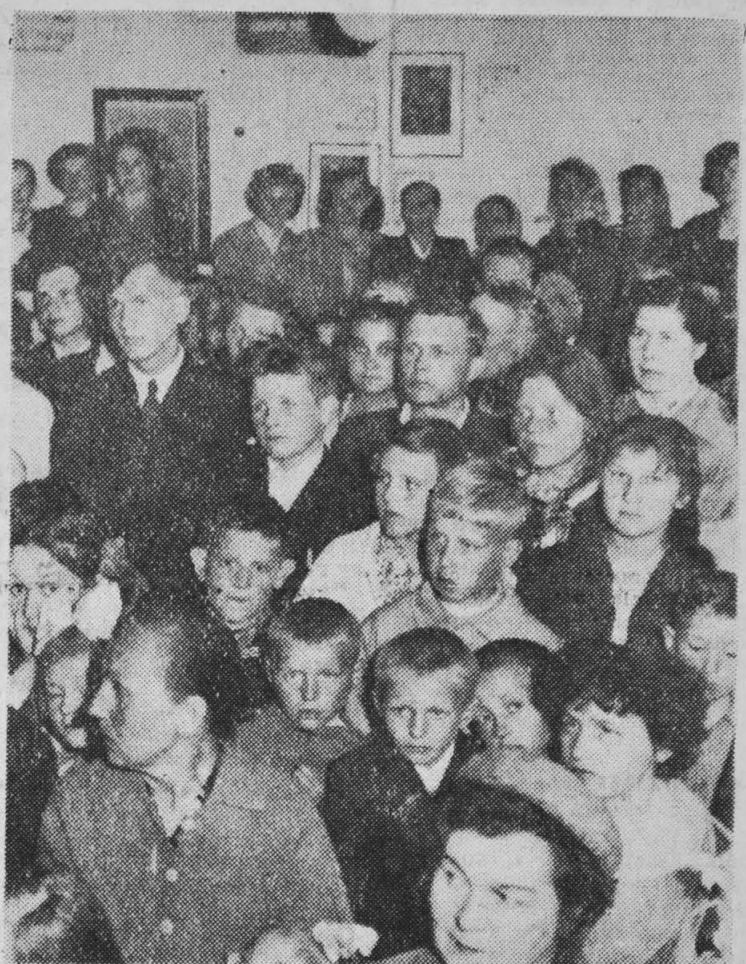
W części artystycznej harcerki deklamowały wiersze Władysława Broniewskiego.

Warto dodać, że podobny napój przyrządza się od dawna w wielu wsiach Suwalszczyzny.