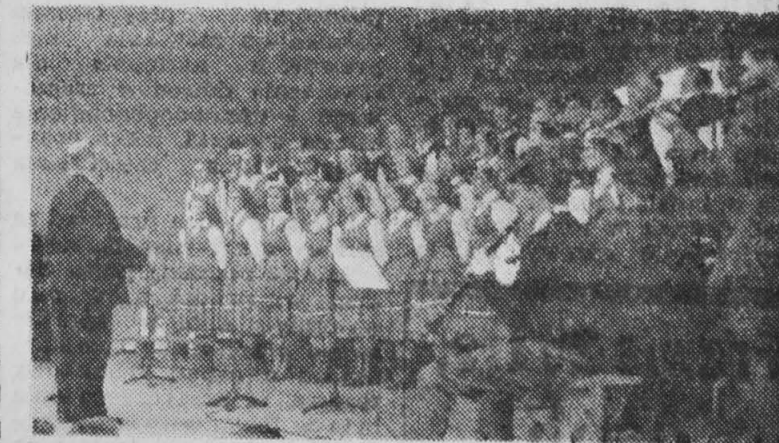
Dużym powodzeniem cieszyły się gościnnie występy Ludowego Zespołu Pieśni i Tańca z Hajnówki.