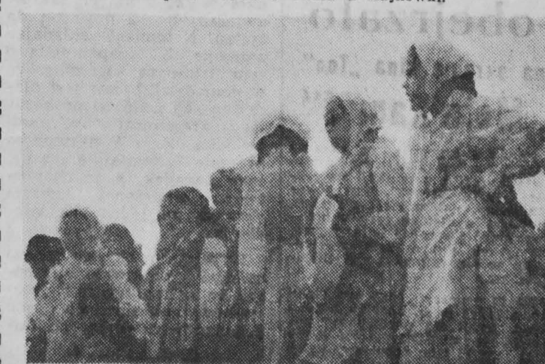
Dzieci ze szkół łomżyńskich przyszyły na festyn w barwnych ludowych strojach.