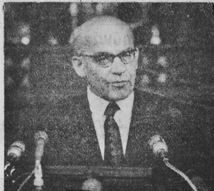
15 maja 1961 r. odbyło się pierwsze inauguracyjne posiedzenie Sejmu PRL. NA ZDJĘCIU: I sekretarz KC PZPR poseł Władysław Gomułka w imieniu Klubu Poselskiego PZPR i z upoważnienia Klubów Poselskich ZSL i SD przedkłada Wysokiej Izbie kandydatury: na przewodniczącego Rady Państwa i prezesa Rady Ministrów