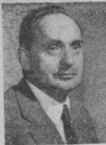
CZESŁAW WYCECHA Marszałek Sejmu