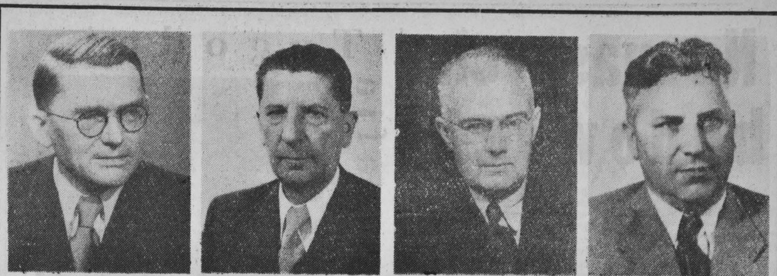
Aleksander ZAWADZKI Przewodniczący Rady Państwa, Stanisław KULCZYNSKI Zastępca Przewodniczącego Rady Państwa, Oskar LANGE Zastępca Przewodniczącego Rady Państwa, Edward OCHAB Zastępca Przewodniczącego Rady Państwa