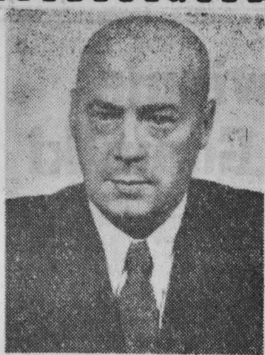
JÓZEF CYRANKIEWICZ Prezes Rady Ministrów