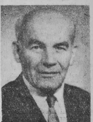
Władysław GOMULKA Członek Rady Państwa