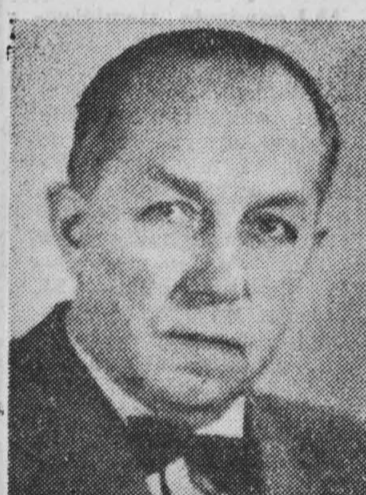
Leon KRUCZKOWSKI Członek Rady Państwa