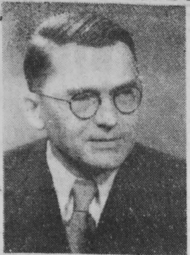
ALEKSANDER ZAWADZKI Przewodniczący Rady Państwa