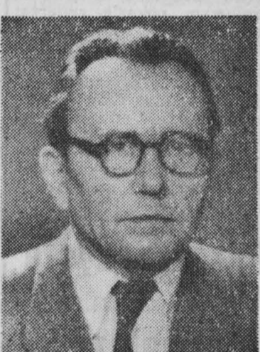
Ignacy LOGA SOWIŃSKI Członek Rady Państwa