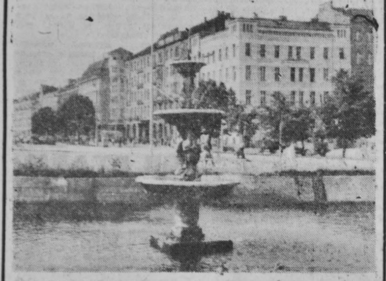
NA ZDJĘCIU: widok na ulicę Karola Świerczewskiego od strony dworca kolejowego.