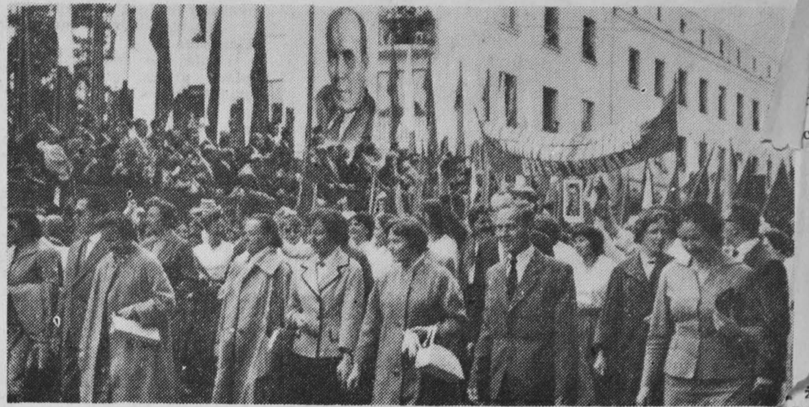
Nie kończące się szeregi manifestantów zajęły całą szerokość ul. Lipowej.

Za harcerzami — dziecięce komitety blokowe TPD, szkoła wychowania obywatelskiego i gospodarskiego.