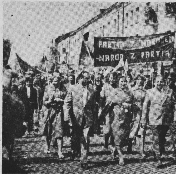
Wiele transparentów głosiło uznanie i poparcie dla słusznej polityki partii.

Tradycja w naszych 1-majowych pochodach jest udział