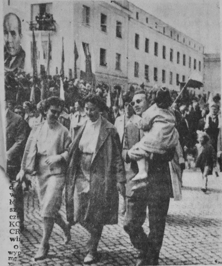
Fragment 1-majowej demonstracji w Białymstoku.