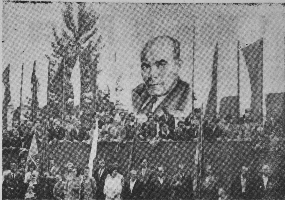
Z trybuny honorowej przedstawiciele władz i organizacji serdecznie pozdrawiają mieszkańców Białegostoku.