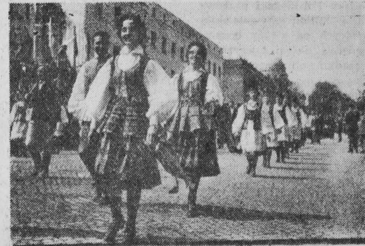
Znany zespół pieśni i tańca — „Kurpie Zielone” zyskał w czasie pochodu wiele braw.