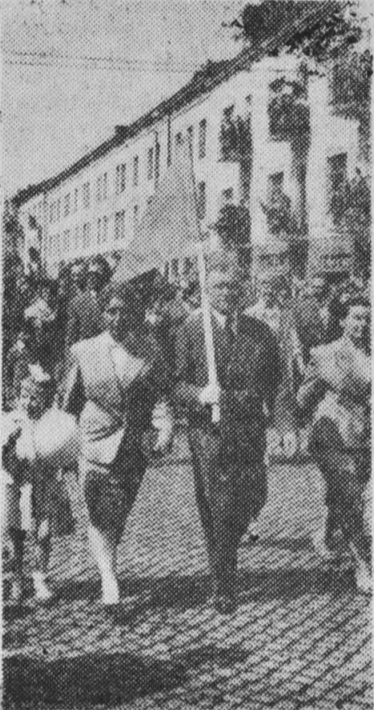
Pod czerwonymi sztandarami maszerowali mieszkańcy Białegostoku.