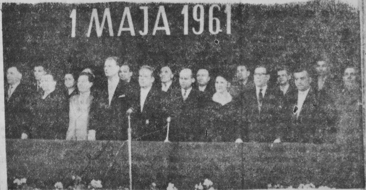
NA ZDJĘCIU: Prezydium uroczystej 1-majowej akademii w Białymstoku.

W części artystycznej wystąpili aktorzy Teatru im. Al. Węgiełki z montażem poetyckim oraz chór i zespół muzyczny Powiatowego Domu Kultury w Sokółce, a także dziecięcy zespół taneczny Miejskiego Domu Kultury w Białymstoku. (bog)