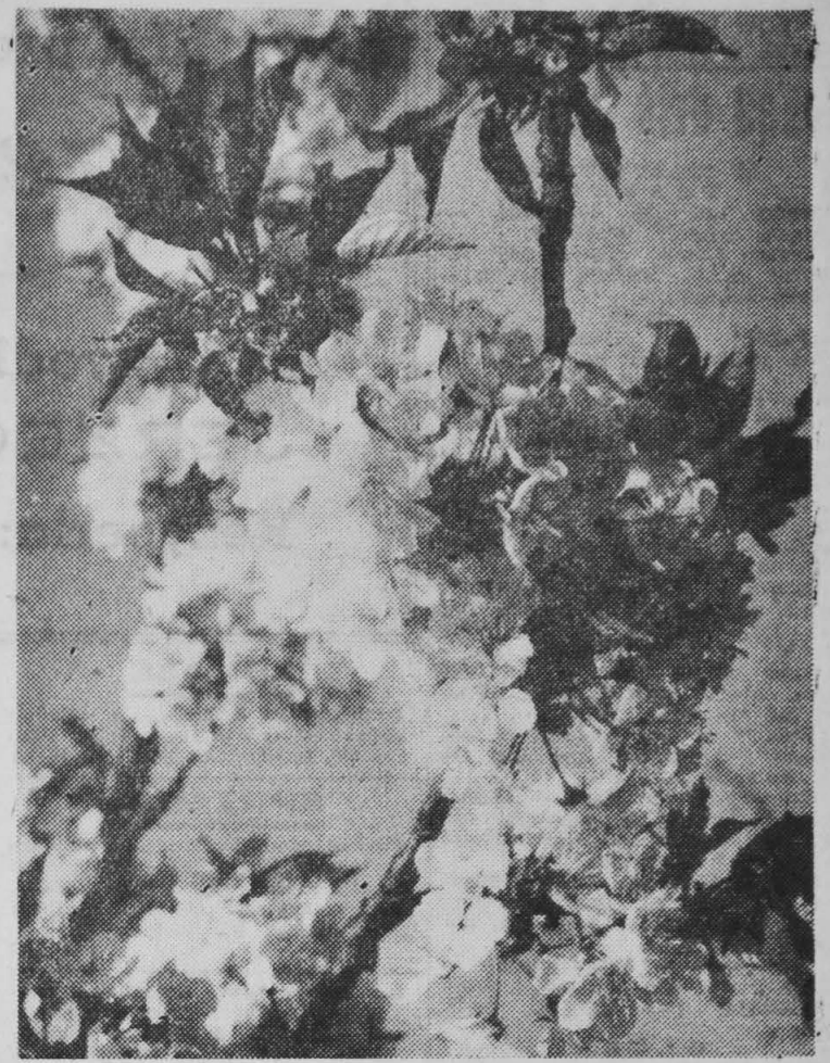
Wiosna...