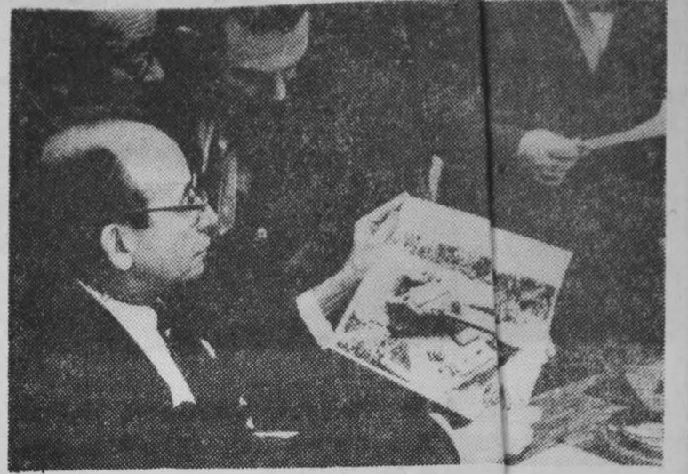
Minister Spraw Zagranicznych Kuby Raul Roa demonstruje w gmachu ONZ fotograficzny dokument udziału USA w zbrodniczej napaści na Kubę; rozbitą przez wojska rządowe na plaży Giron w prowincji Las Villas amerykański czołg typu Sherman.