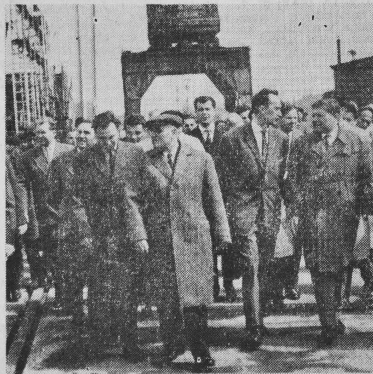
NA ZDJĘCIU: goście rumuńscy podczas zwiedzania stoczni szczecińskiej.