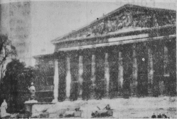
24 kwietnia w godzinach porannych czolgi stanęły na straży gmachu parlamentu w Paryżu.