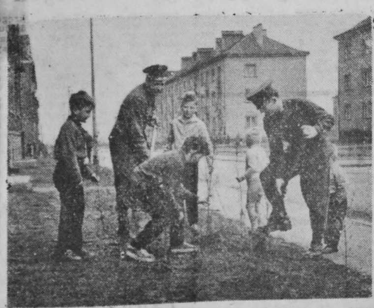
7.100 tysięcy drzewek i 6 milionów krzewów zostanie zasadzonych w bieżącym roku dla uczczenia Tysiąclecia Państwa. NA ZDJĘCIU: z inicjatywy ZMS w Gliwicach w akcji sadzenia drzewek wzięła udział młodzież z zakładów pracy, szkół i miejscowej jednostki wojskowej.