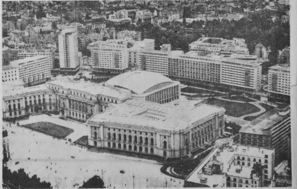
Zdjęcie lotnicze centrum Bukaresztu z nowoczesnymi blokami mieszkalnymi na drugim planie.

Bogaty jest plan budowy obiektów socjalno-kulturalnych. W roku 1961 w Bukaresz-