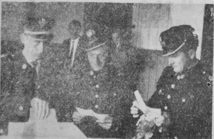
Strażacy z Rusi Starej (pow. wysokomazowiecki) przyszedli do wyborów w pełnej gali.

Dziennikarze pytają jeszcze. Ciąg dalszy na str. 2