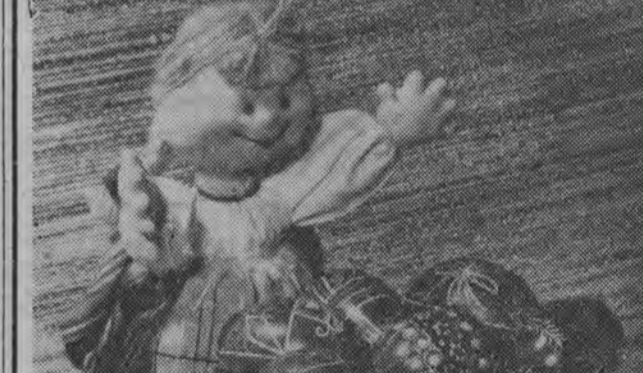
Pisanki... pisanki...