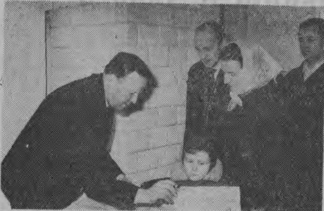
NA ZDJĘCIU: sprawdzanie list w Obwodowej Komisji Wyborczej nr 13 w Technikum Gastronomicznym w Białymstoku.

Według doniesień jemeńskich rozgłoszeni radiowi, w poniedziałek dokonano zamachu na życie króla Jemenu Imama Ahmeda. Zamachowcy oddali do króla kilka strzałów w chwili gdy powracał do swego pałacu z portu. Hodeida nad Morzem Czerwonym. Zamach się nie udał. Kilka osób towarzyszących królowi odniosło rany.