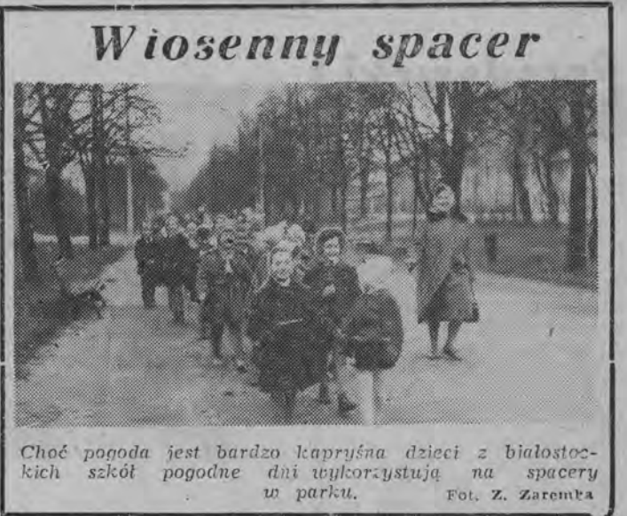
Choć pogoda jest bardzo kapryśna dzieci z białostockich szkół pogodnie dni wykorzystują na spacer w parku.

W redakcji czeka, na właściciela legitymacja kolejowa wydana na nazwisko Apolonii Bieleckiej. Natomiast przy ul. Jurjewickiej 42 m. 1 odebrać można kapeluszy i szalik, znalezione 23 bm. (jap)