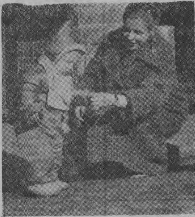
Odważnie syneczku...