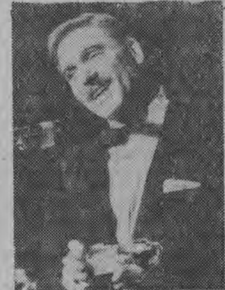
Hollywoodzkie Stowarzyszenie Prasy Zagranicznej...