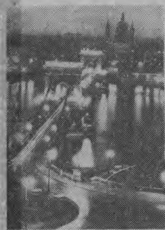
Most łańcuchowy w Budapeszcie.

Zgadzamy się — powiedział Pheng Phongsavang — na reaktywowanie międzynarodowej komisji nadzoru i kontroli pod przewodnictwem Indii, jednakże zadania tej komisji powinny być sprecyzowane przez nową konferencję typu genewskiego. Komisja ta powinna utrzymywać stosunki jedynie z rządem Souvanna Phoumy będącym jedynym legalnym rządem Laosu.