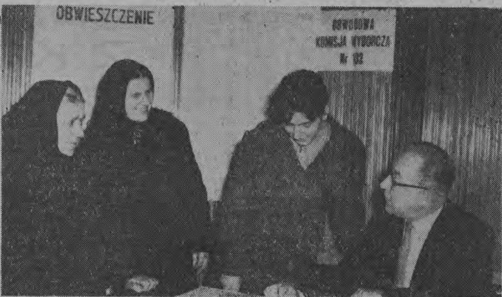
We wszystkich lokalach obwodowych komisji wyborczych w całym kraju, począwszy od 12 marca wyłożone zostały spisy wyborców. Każdy obywatel winien sprawdzić czy jego nazwisko prawidłowo zostało wpisane. NA ZDJĘCIU: już w pierwszym dniu wyłożenia spisów — lokale komisji odwiedziły wyborcy, spełniając swój pierwszy, przedwyborczy obywatelski akt.

DZIS zachmurzenie o charakterze zmiennym. Temperatura maksym. +10 stopni C. Wiatry umiarkowane północno-zachodnie.