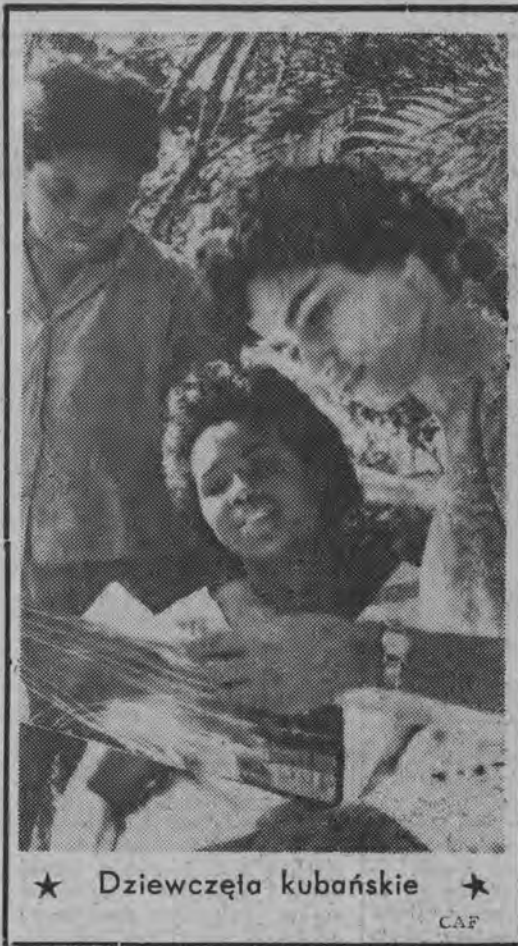
★ Dziewczyna kubańska ★

Między Polską a Zjednoczoną Republiką Arabską podpisane zostało niedawno memorandum o współpracy w dziedzinie rybołówstwa. W realizacji, pierwszej części porozumienia, tzn. rozbudowy zaplecza portów rybackich w Port-Saidzie, Damietcie oraz w zaplanowaniu portu w Ghazie uczestniczyć będzie Biuro Projektów Budownictwa Morskiego w Gdansk. Natomiast przygotowanie projektów stoczni remontowo-produkcyjnej w Aleksandrii przypadnie w udziale gdańskiemu „Prozametowi“.