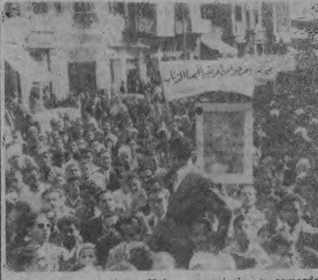
Wielka demonstracja w Kairze w związku z zamordowaniem Lumumby.