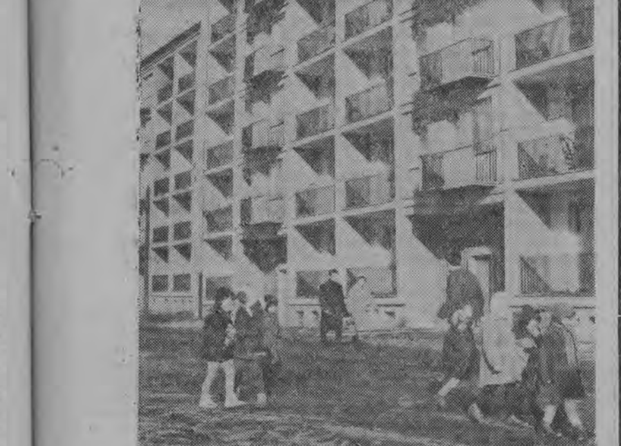
Kolorowe bloki, potężne wieżowce, całe osiedla budowane w tak zwanym stylu szwedzkim, nadają temu najmodniejszemu miastu wielki urok. NA ZDJĘCIU: na osiedlu D-1.