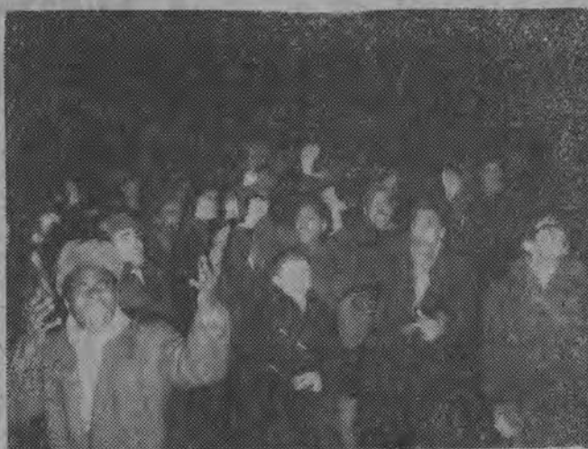
W dniu 14 bm. przed gmachem ambasady belgijskiej w Warszawie odbyła się manifestacja studentów protestujących przeciwko ohydnej zbrodni popełnionej na premierze Lumumbie i jego najbliższych współpracownikach.