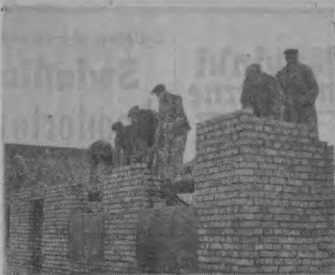
Brygada Konstantego Sliwki na murze.