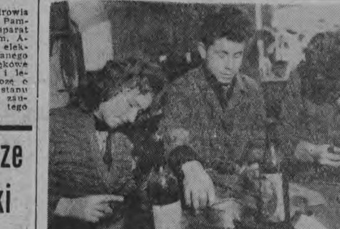
NA ZDJĘCIU: młodzi spółdzielcy przy pracy.

Żuż w 1959 r. ZMS-owcy — uczniowie Obojczyckiej Szkoły w Otmęcie postanowili zorganizować spółdzielnię, która prowadziłaby reperację wszelkiego rodzaju obuwia, nawet białego. Długo nie czekano na realizację słusnej i pozytywnej inicjatywy. Mieszkańcy pobliskiego osiedla dotarli do realizacji swego planu. Długo nie czekano na realizację swego planu. Długo nie czekano na realizację swego planu.