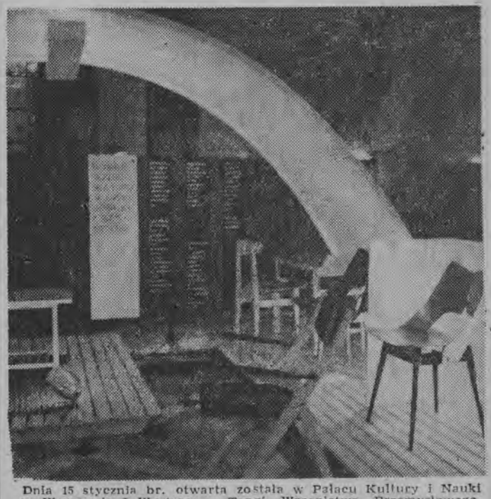
Dnia 15 stycznia br. otwarta została w Pałacu Kultury i Nauki w Warszawie i Wystawa - Targi Wzornictwa Przemysłowego...