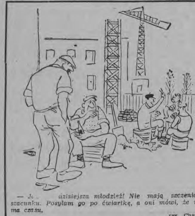
Już dzisiaj młodzież! Nie mają szczeniaki szacunku. Posyłają go po ciastki...