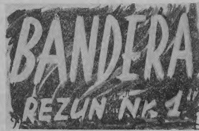
OŚRODEK DYWERSJI I SZPIEGOSTWA — MONACHIUM

Po wojnie Bandera szybko orientuje się w sytuacji. Już w 1946 roku wypływa na „powierzchnię“ w Monachium — NRF i ujmuje w swoje ręce kierownictwo band UPA i podziemia OUN w Polsce.