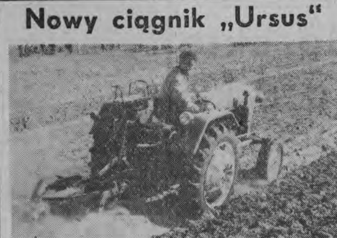
Nowy ciągnik „Ursus”

Wartość czynów ok. 1 mln zł Pracowało 1041 furmanek i 1207 pieszych Pracownicy Prez. PRN budują drogę