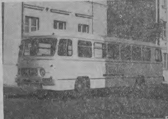
NA ZDJĘCIU: autobus „Gromada”. Tekst i zdjęcie: Hr.

W czasie śledztwa udowodniono mu również dokonanie licznych kradzieży na terenie Białegostoku. Między innymi skradł