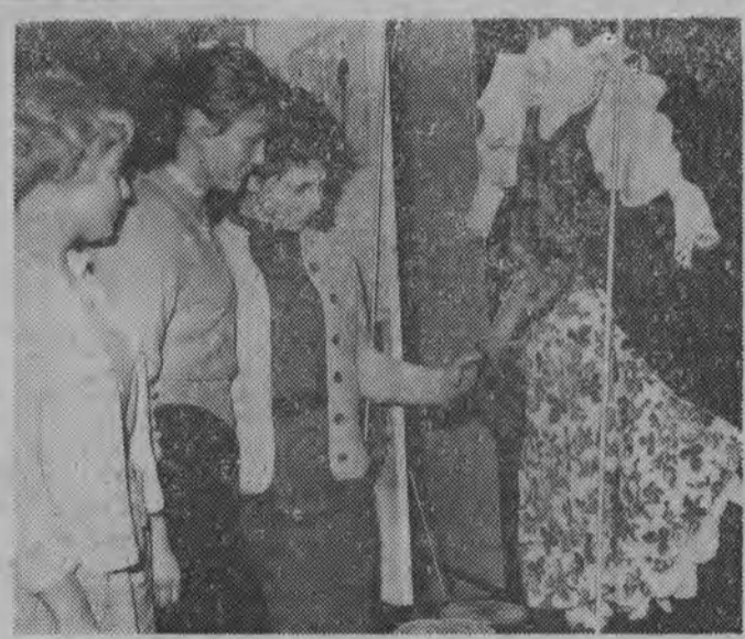
W Dreźnie otwarto wystawę na temat: „Szkołnictwo zawodowe w FRL”. Objazdowa wystawa polska również eksponowana będzie w Berlinie i Rostocku. NA ZDJĘCIU: uczniowie szkół zawodowych liczenie odwiedzają wystawę.

WASZYNGTON (PAP) 9. 11. Lotnictwo amerykańskie podało do wiadomości, że 140-kilogramowy pojemnik nie oddzielił się od wyrzucanego w sobotę nowego amerykańskiego sztucznego satelity Ziemi „Discoverera-7”. Komunikat głosi, że zawiodło urządzenie mające oddzielić pojemnik od satelity.