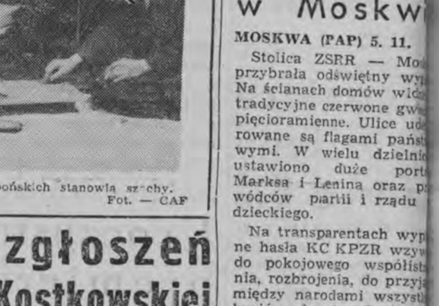
Uлюбiona rozrywka robotników japońskich stanowią srebry.