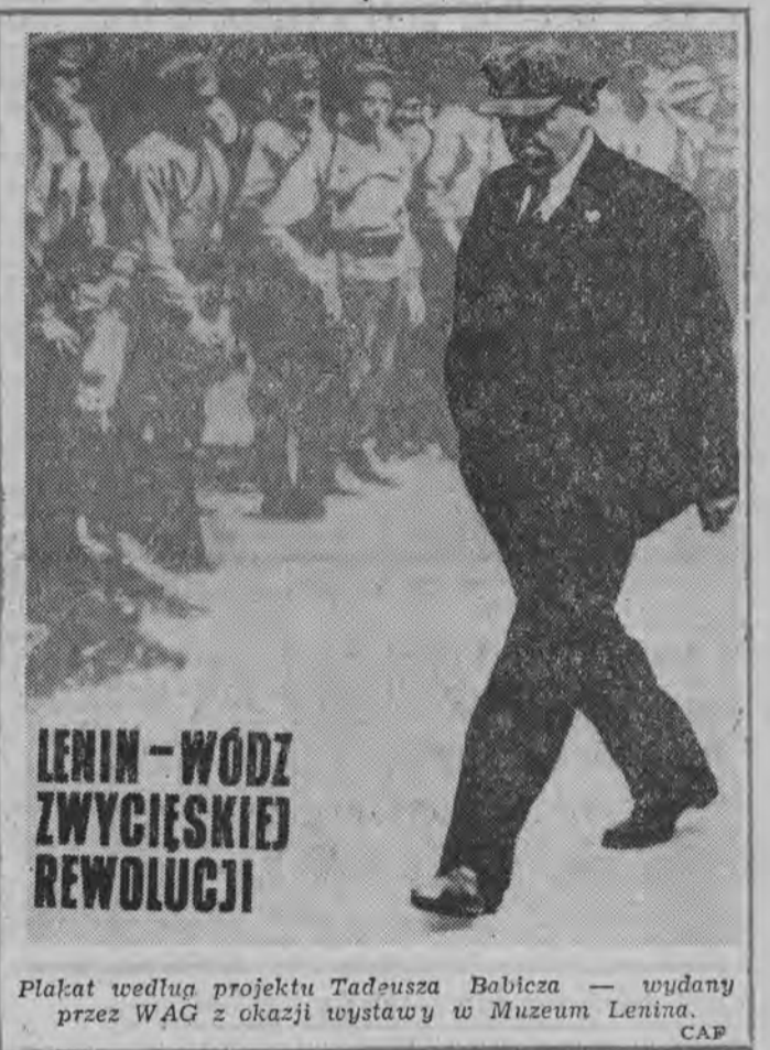
LENIN - WÓDZ ZWYCIĘSKIEJ REWOLUCJI