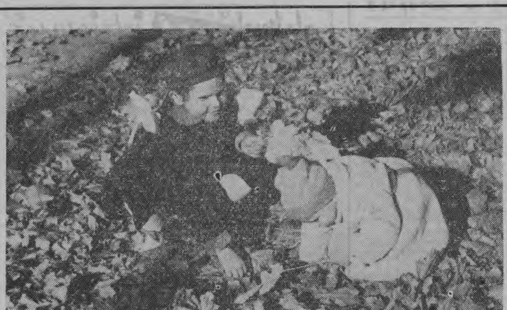
Zbieramy ostatnie liście.

Zgłoszenia przyjmuje Spółdzielnia „Turysta” do 6 bm. (sg)