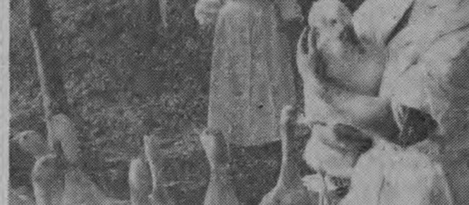
Współpraca nie byle jaka

O kontakcie takim towarzyszy ze zarządu mówili przez chwilę jako o pod-tawie ich współpracy ze wsią, a także podstawie do wytyczania właściwych kierunków oddziaływania na rolnictwo w granicach powiatu... Słuchając się, przebiega w niektórych powiatach i tacy ak-