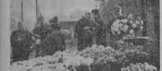
NA ZDJĘCIU: u bram cementarnych — stoiska z kwiatami...

wpłacił 7.600 zł, mieszkańcy wsi Sulimy w gromadzie Chmielewo wpłacili na SFBS 26 tys. zł. Słownikowo dobrze realizują również swoje plany zbiórki na SFBS gromady Wąsk, Wąsłki i Matwiec. Niemniej jednak podawano nazwiska ludności, która nie wpłaciła się jeszcze ze swego