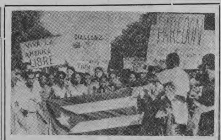
Manifestacja w Hawanie dla poparcia Fidel Castro.