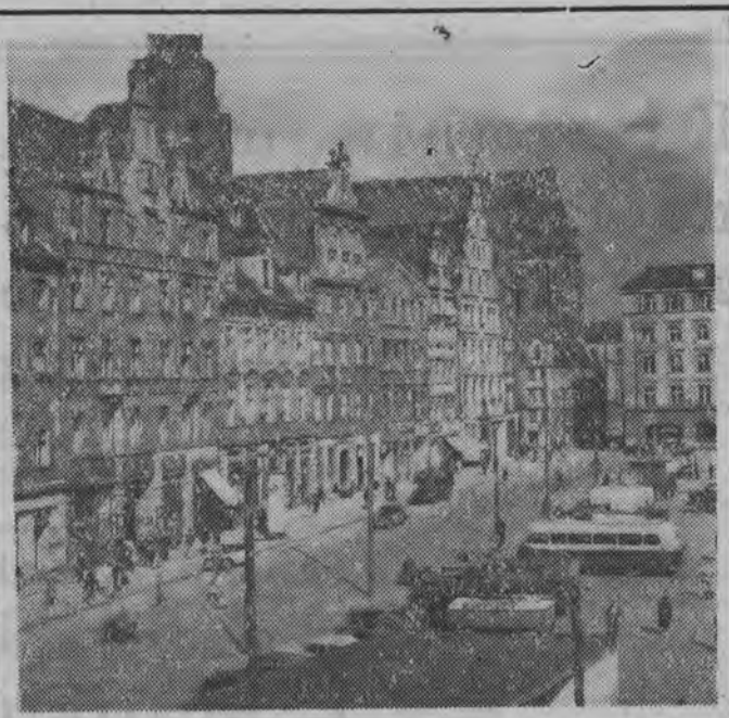
Na zdjęciu: fragment Rynku we Wrocławiu.