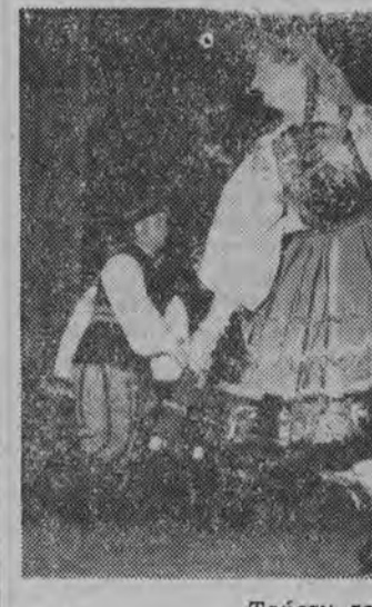
Tańczy zespół „Łowicz”...

St. sierżant Stanisław Barański mimo natychmiastowej pomocy zmarł wskutek odniesionych ran. Wstępne dochodzenie ustaliło, że celem bandytów, którzy dokonali napadu na posterunek MO w Lubominiu była chęć zdobycia broni w celu prowadzenia rabunków.