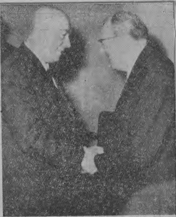
NA ZDJĘCIU: premier Cyraniewicz składa życzenia premierowi NRD Grotewohlowi

Na lotnisku władywostockim Chruszczow zżegnał tysięce mieszkańców miasta.