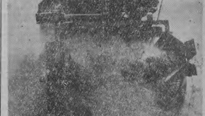
Wzrost inwestycji w naszym województwie pociągają za sobą nieuchronnie rozwój produkcji materiałów budowlanych.

Wszystko to jest przyczyną tego, że budujemy długo. Nie ma to być jednak przyczyną tego, że budujemy długo. Nie ma to być jednak przyczyną tego, że budujemy długo.