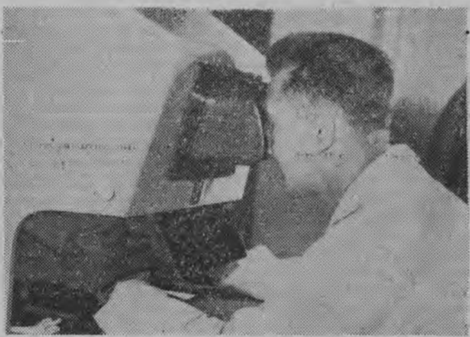
Aparat do identyfikowania odcisków linii papilarnych.

W naszym fotoreportażu pragniemy przedstawić Czytelnikom trudną i odpowiedzialną pracę milicji od strony mało dotąd znanej.