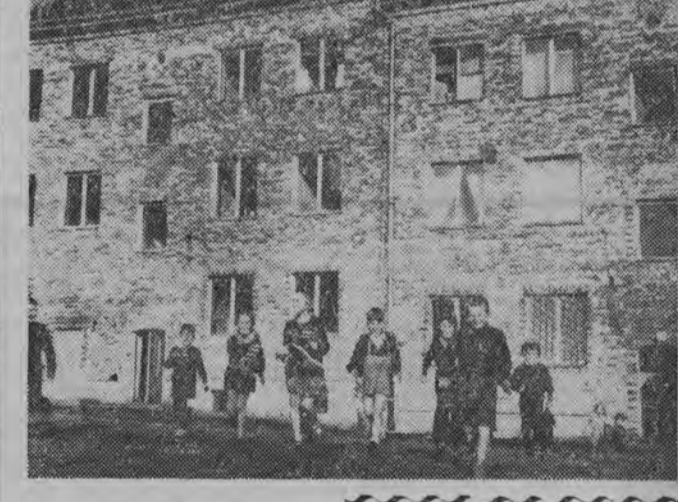
W osiedlu robotniczym.