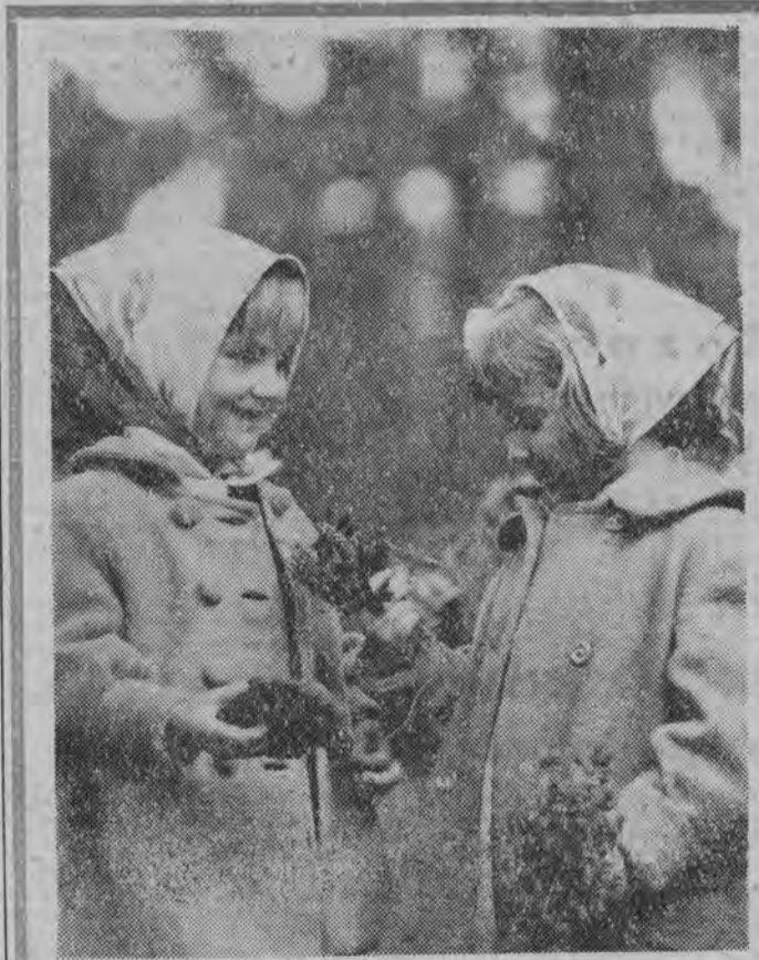
Złota polska jesień. Przedszkolanki na wycieczce w lesie...

W momencie gdy służba meteorologiczna ostrzegła mieszkańców stanów Północna Karolina i Georgia przed niebezpieczeństwem, doniesiono o zbliżaniu się nowego groźnego tornado w kierunku Florydy. W chwili gdy zarejestrowano zbliżanie się huraganu, znajdował się on w odległości 2.400 km od Miami. Nowe tornado otrzymało nazwę „Hannah”