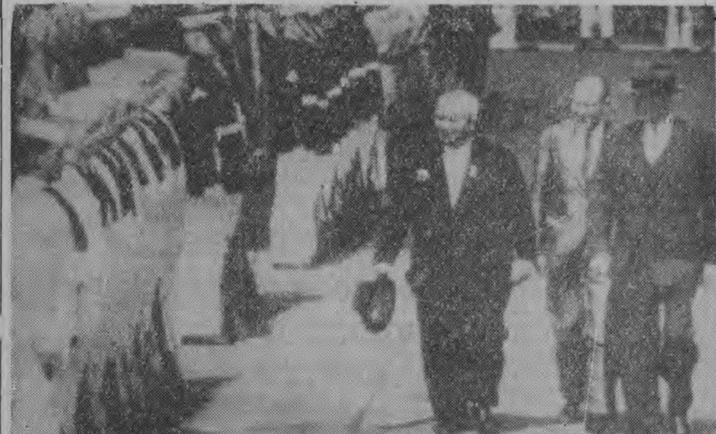
Wizyta N. S. Chruszczowa w USA. NA ZDJĘCIU: N. S. Chruszczow i prezydent Eisenhower przed frontem kompanii honorowej na lotnisku Andrews koło Waszyngtonu.