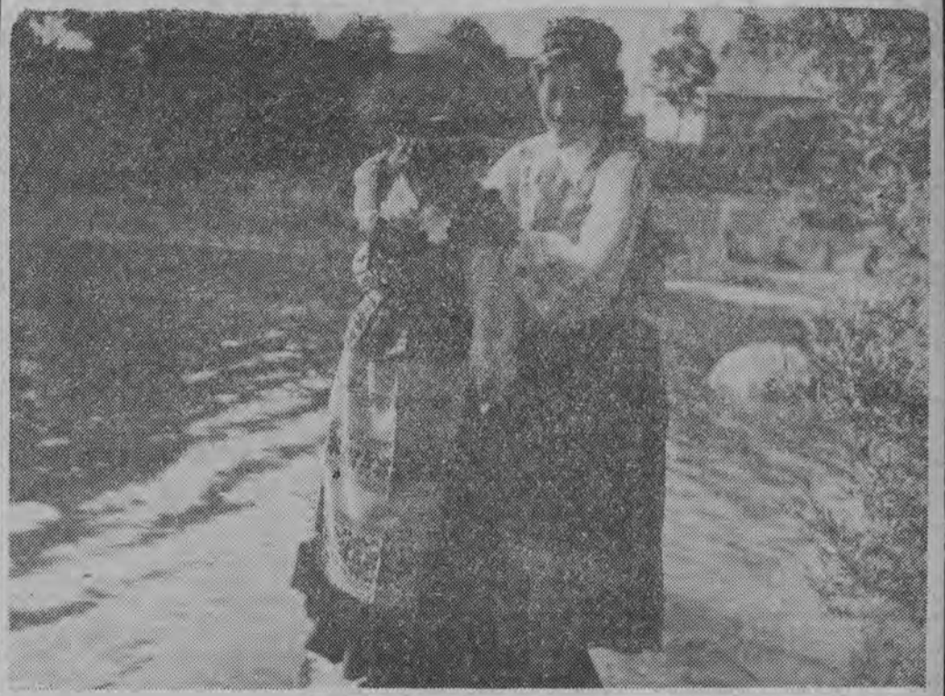
Dziewczeta z okolic Puńska w pięknych, ludowych, litewskich strojach.