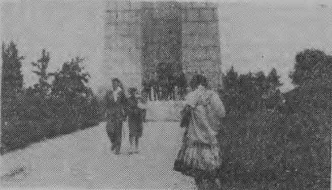
Pomnik ku czci Polaków pomordowanych w Mathausen.