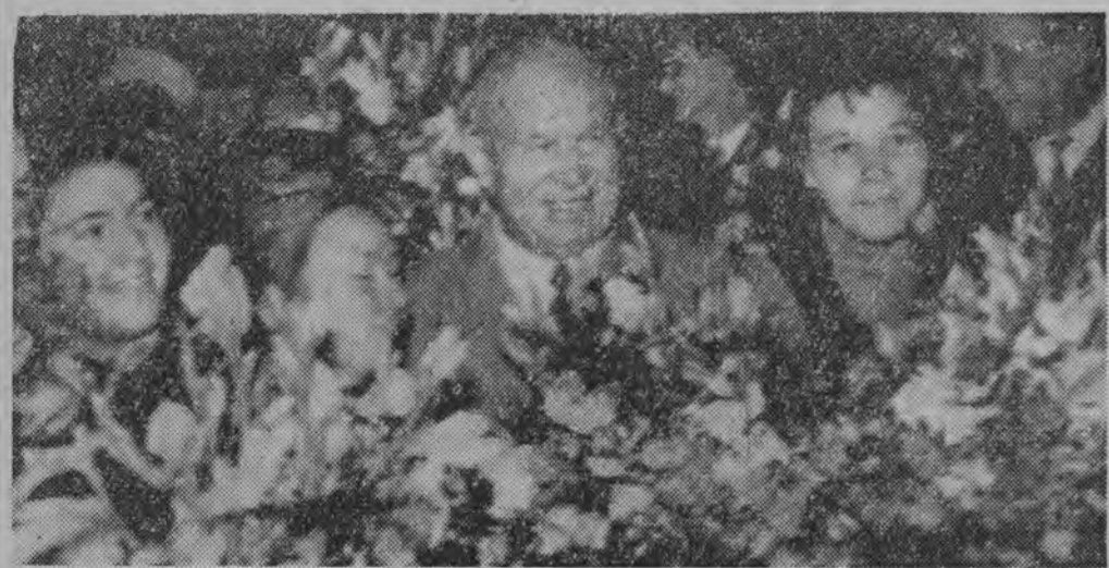
W dniu 15. IX. 1959 r. przewodniczący Rady Ministrów ZSRR N. S. Chruszczow opuszcza Moskiewę, udając się do Stanów Zjednoczonych. NA ZDJĘCIU: pożegnanie N. S. Chruszczowa na lotnisku Wnukowo.