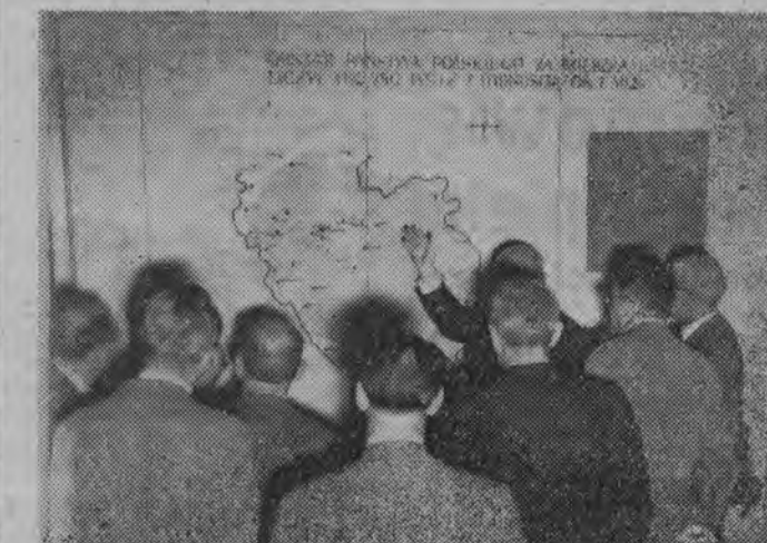
Uniwersytet Warszawski przy współudziale Instytutu Historii Kultury Materialnej PAN zorganizował wycieczkę grupy archeologów zagranicznych bawiących w Polsce na teren wykopalisk w Sieradzu oraz do Muzeum Archeologicznego w Łodzi.

Warto przy tej okazji przypomnieć, że organizacja, która w marcu 1957 r. liczyła zaledwie 41 tys członków zrzesza dziś już ponad 300 tys. młodych robotników, pracowników umysłowych, uczniów i studentów.