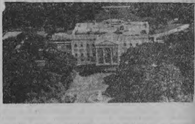
Biały Dom — siedziba prezydenta Stanów Zjednoczonych, w której toczyły się będą rozmowy Chruszczowa — Eisenhowera.

W niedzielę wzięli udział w wyprawie do San Francisco.