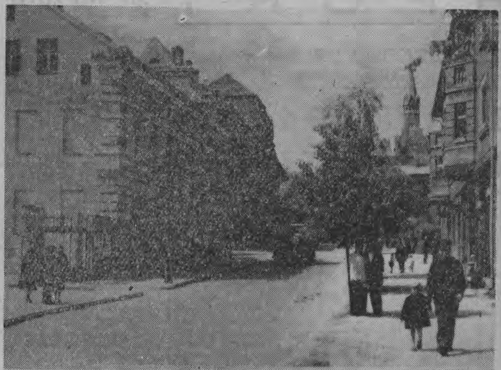
NA ZDJĘCIU: fragment jednej z ruchliwszych ulic miasta