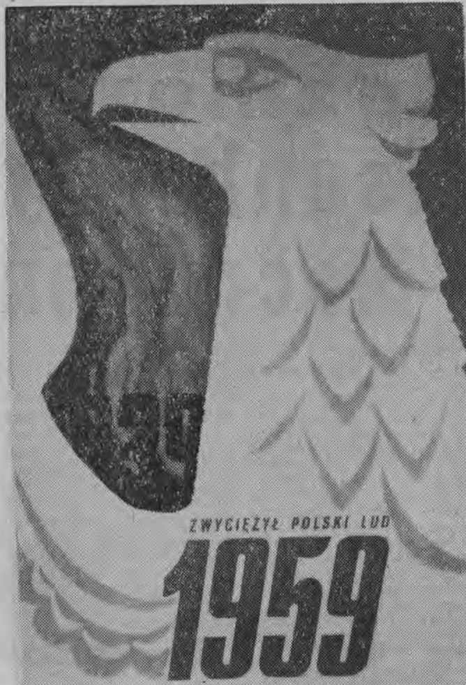
Plakat wydany przez WAG z okazji 50 rocznicy wybuchu II Wojny Światowej i Kongresu ZBoWiD. Autorzy: G. Małewski i J. Stomczyński.

Min. Bienkowski wygłosi swe przemówienie w szkole — pomniku Tysiąclecia w Gostkowie pod Toruniem.